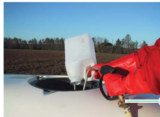
Versorgung mit klarem Wasser

2. Drehen Sie den leeren Behälter über das Mannloch und führen Sie die Rotationsdüse in den Behälter ein.