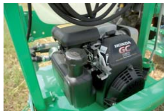
Lavotop existiert auch in der Version mit vollständig autonomem Verbrennungsmotor