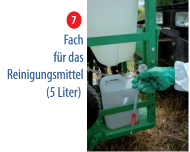
7 Fach für das Reinigungsmittel (5 Liter)