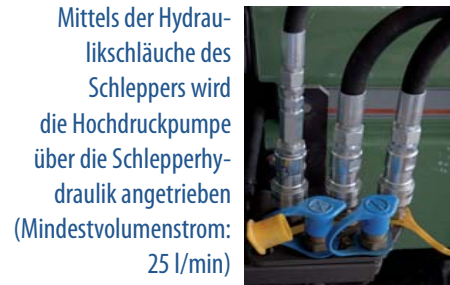
Mittels der Hydraulikschläuche des Schleppers wird die Hochdruckpumpe über die Schlepperhydraulik angetrieben (Mindestvolumenstrom: 25 l/min)